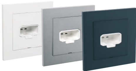
Infällda vägguttag i Plus-serien.

Varken den nya standarden SS-EN 61995-1 och -2 eller DCL-uttagen är nya, utan fastställdes som standard redan under 2009. Dock har en övergångsperiod på tio år löpt sedan dess, där både de gamla och nya standarderna varit i drift. Gamla standarden SS 428 08 31 revideras, för att från och med 1 april 2019 endast gälla lampproppar och ojordade lampputtag. Från 1 april 2019 finns bara en gällande standard för jordade lampputtag, SS-EN 61995-1 och -2, benämnda i Elinstallationsreglerna som DCL (Devices for connecting of luminaires).